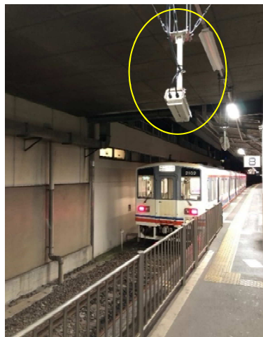
【画像解析用カメラ】

本実証実験は2023年3月31日まで実施いたします。今後は、実証実験で得られたデータを基に開発を推進し、より一層安全で安心な鉄道の利用に貢献してまいります。