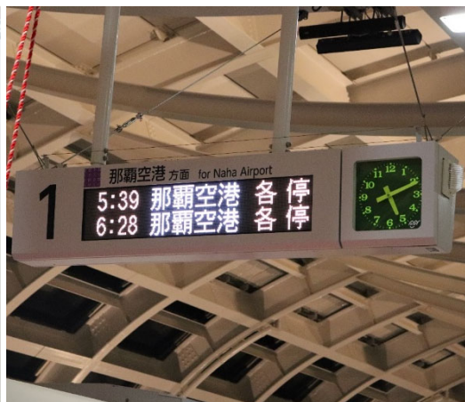
当社製 旅客案内表示装置