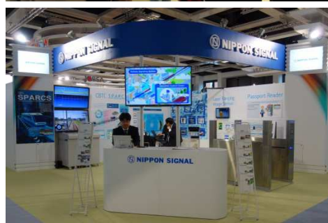
InnoTrans 2016 我司展区